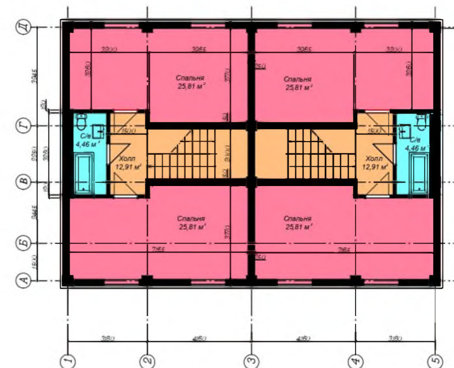
План 2-го поверху